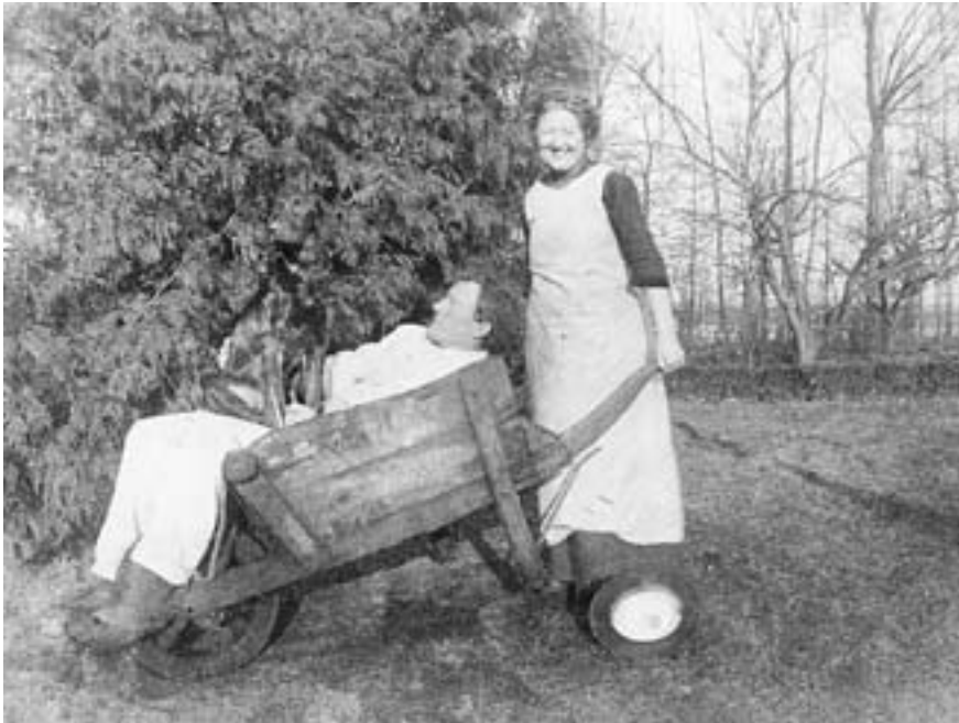
Familieidyl på Sankt Claravej. Her får AWL en tur af Antonie i trillebør. På skødet sidder deres Irske Setter.

en hund i AWL's barndomshjem og senere på et familiefoto foran huset. AWL havde selv hund, en Irsk Setter; som sidder på skødet af ham medens konen kører dem i en trillebør